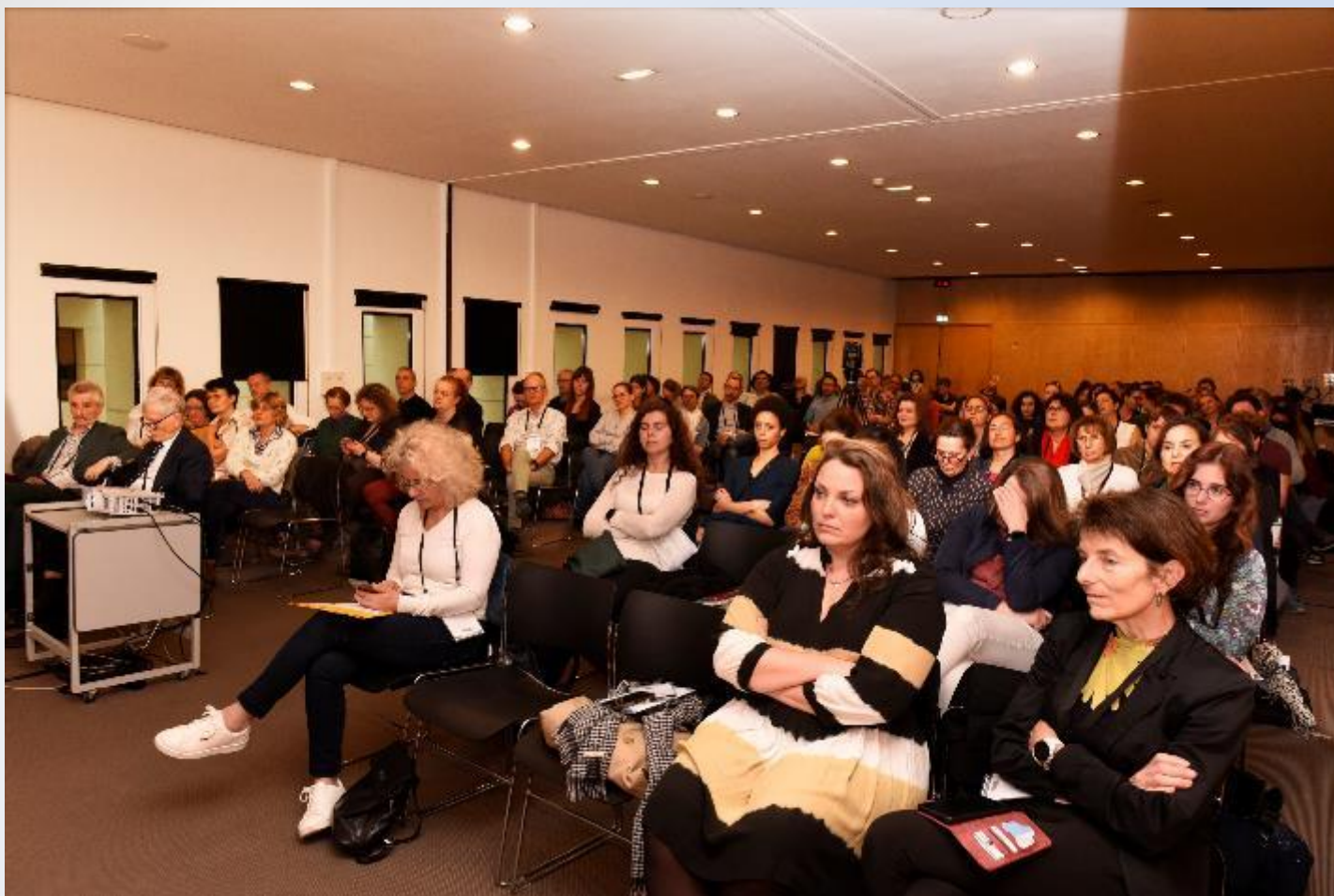
Entretiens de médecine physique et réadaptation (EMPR) « Prescription médicale et Médecine thermale » Montpellier, le 29 mars 2024